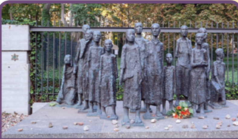
אנדרטה לזכר יהודי ברלין שנרצחו בשואה

ניתן לקרוא את המוסף באתר עיריית נס ציונה