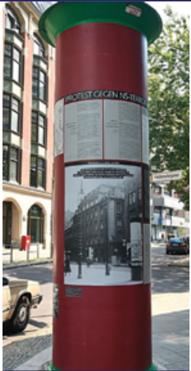
עמוד מודעות הגזרות ליהודי ברלין